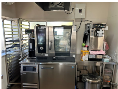
【販売事業者】 株式会社フジマック