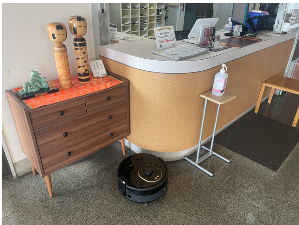
【販売事業者】 アイグッズ株式会社