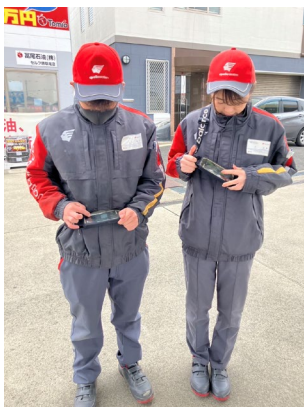
【販売事業者】 株式会社タツノ