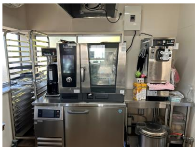
【販売事業者】 株式会社フジマック