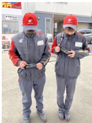
【販売事業者】 株式会社タツノ